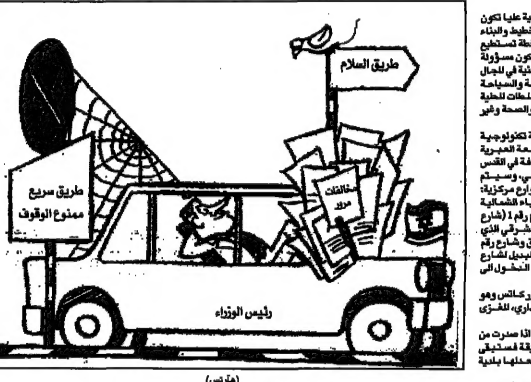
ديوان الزوايا (مقر)

قانون العودة يمنح اليهود الروس واحفادهم... قانون العودة يمنح اليهود الروس واحفادهم